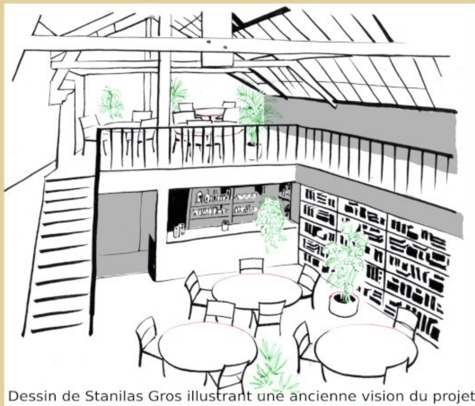
Dessin de Stanilas Gros illustrant une ancienne vision du projet